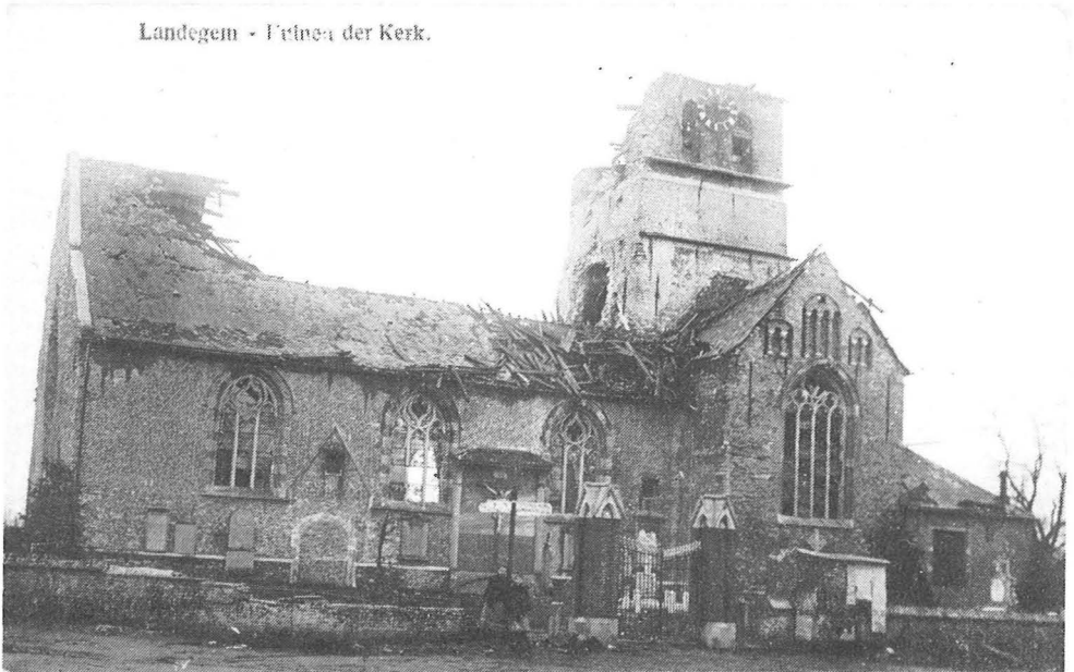
Puinen van de kerk van Landegem in 1918.